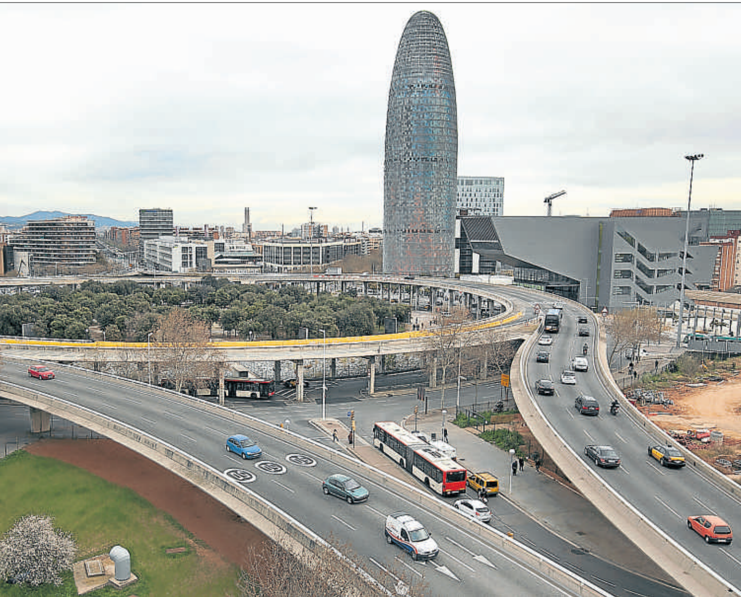
El anillo. Las obras de demolición del paso elevado se iniciarán el próximo octubre