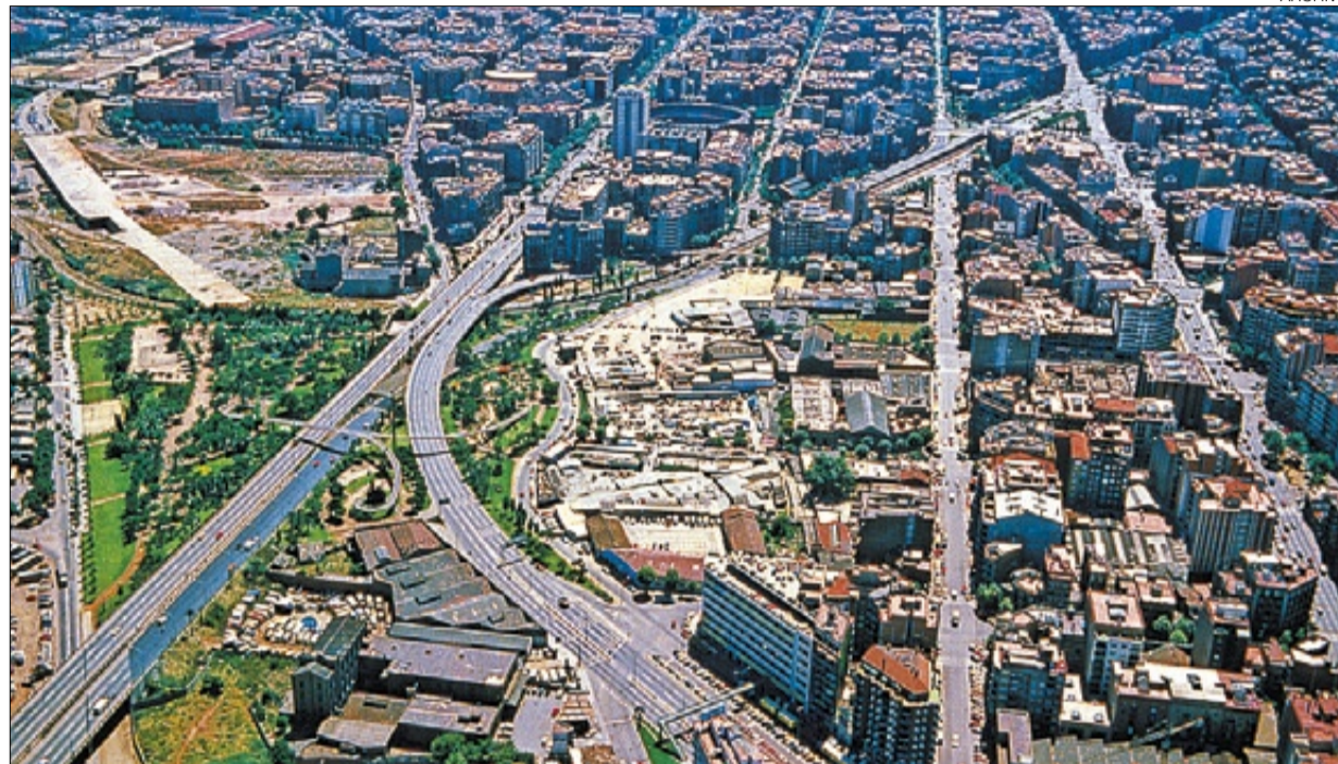
►► El antes... ► Imagen de la plaza en 1988, antes de la reforma con el actual tambor.

Afirma, asimismo, que en lo que él está trabajando es en la creación de unas «pautas urbanísticas» pero sin querer concretar un diseño del espacio público. Eso, el proyecto arquitectónico más que urbanístico, se hará más adelante. ≡