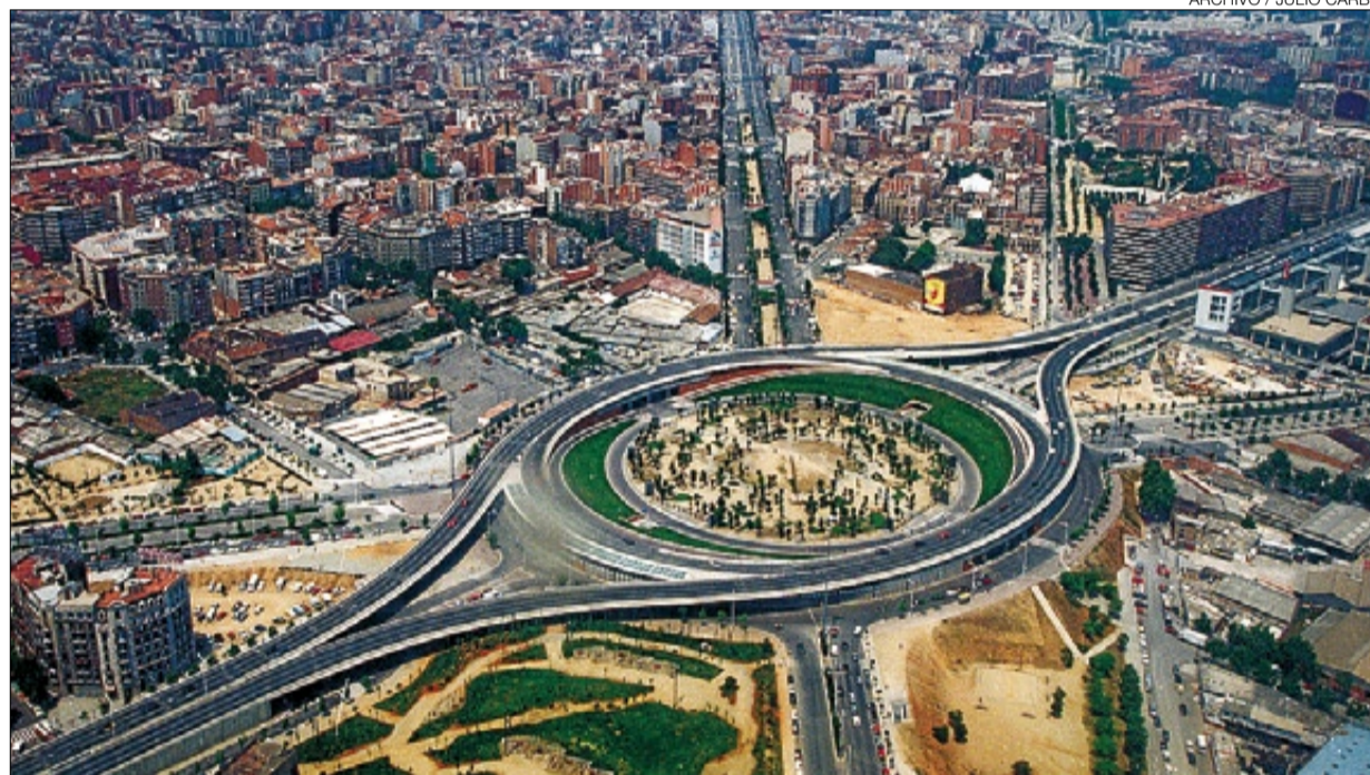
►► Y el después... ► El tambor, con el parque en su interior, en todo su esplendor, en 1995.